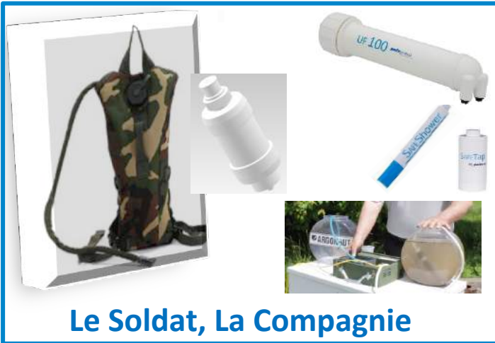
Le Soldat, La Compagnie