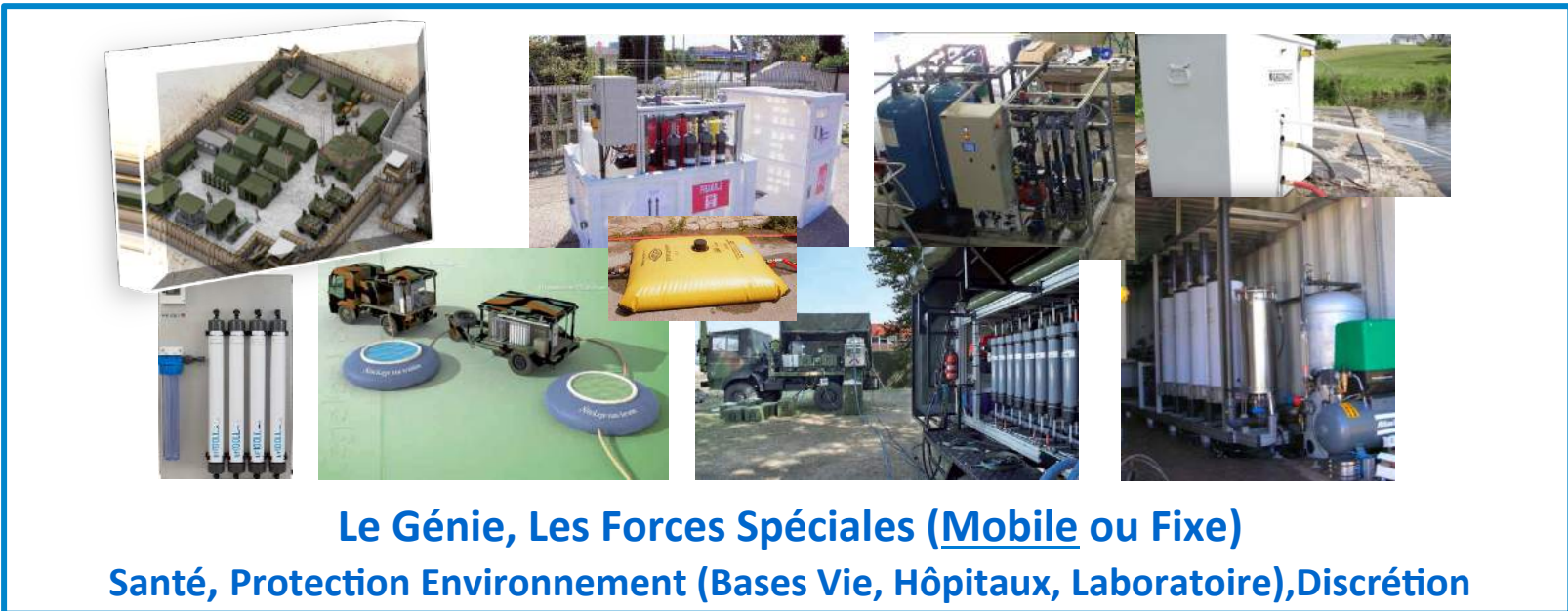
Le Génie, Les Forces Spéciales ( Mobile ou Fixe)

Santé, Protection Environnement (Bases Vie, Hôpitaux, Laboratoire), Discrétion