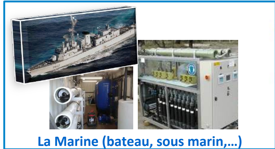
La Marine (bateau, sous marin,...)